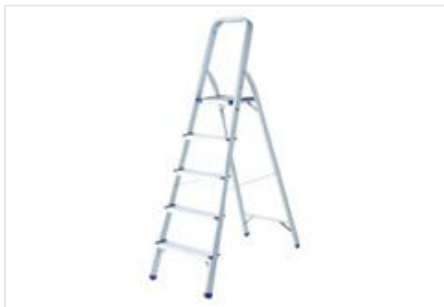
ESCALERA HOGAREÑA DE 5 ESCALONES