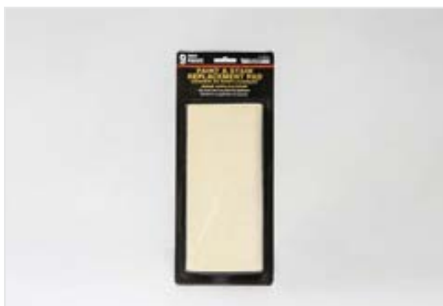
NRO. 1 REPUESTO APLICADOR TIPO LLANA