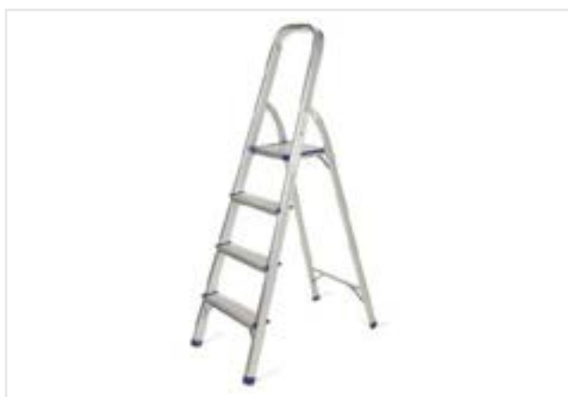
ESCALERA HOGAREÑA DE 4 ESCALONES