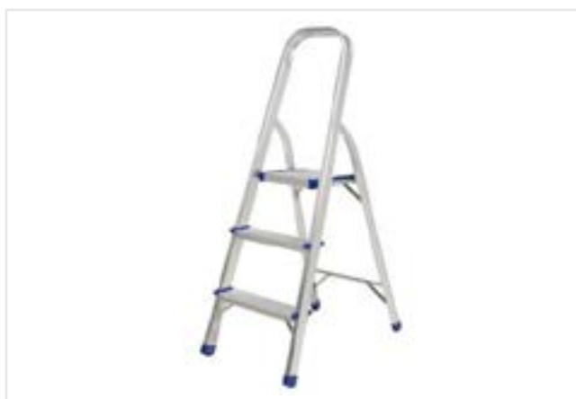
ESCALERA HOGAREÑA DE 3 ESCALONES