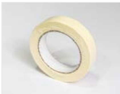
CINTA DE ENMASCARAR