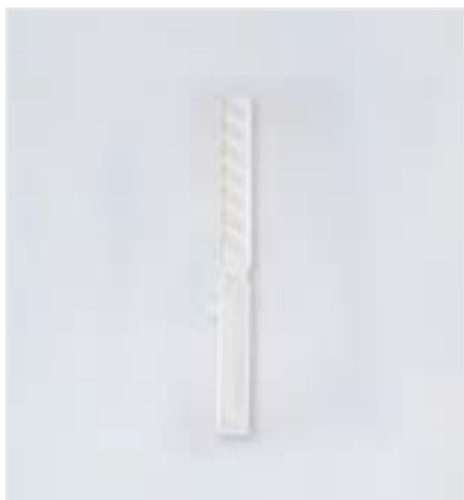
REMOVEDOR DE PINTURA